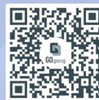
SPF's Anti-Scam Resource Guide Information and relevant FAQs for scam victims

For more information on this scam, visit SPF | News (police.gov.sg)