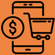
Penipuan E-Dagang (Varian penipuan)