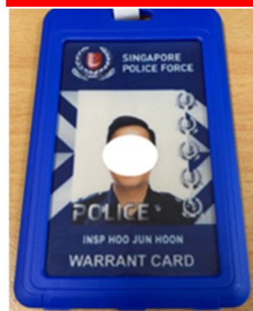
Photo of fake Police warrant card sent to the victim.