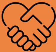
Penipuan Panggilan Kawan Palsu