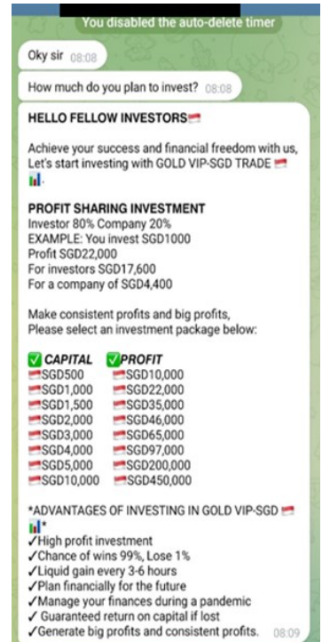
来自Telegram 聊天群组的虚假投资机会

欲了解更多关于这个骗局的信息, 请浏览 SPF | News (police.gov.sg)