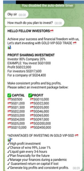
Peluang pelaburan palsu daripada Kumpulan Sembang Telegram

Untuk maklumat lanjut mengenai penipuan ini, sila layari SPF | News (police.gov.sg)