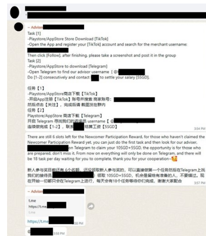
Penipu menyamar sebagai perekrut menawarkan wang tunai dengan cepat